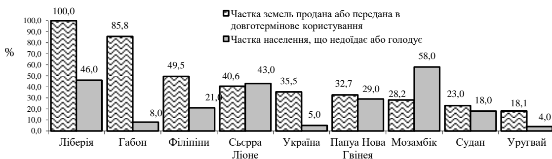
Рис. 1. Частка орних земель, переданих у довготермінову оренду або проданих нерезидентам, та частка населення, яка голодує або недоїдає у різних країнах.

Крім того, навіть за відсутності ринку земель сільськогосподарського призначення, за оцінками міжнародних експертів України входить до десятки країн з найвищим рівнем грабування земель.